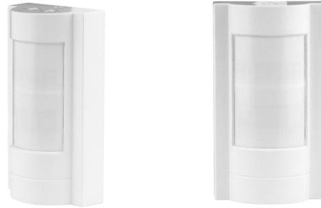
PIR sensor de movimiento de superficie SDAP