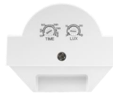
Cursores de los ajustes del sensor